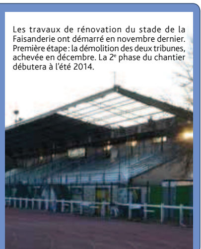
Les travaux de rénovation du stade de la Faisanderie ont démarré en novembre dernier. Première étape : la démolition des deux tribunes, achevée en décembre. La 2 e phase du chantier débutera à l'été 2014.